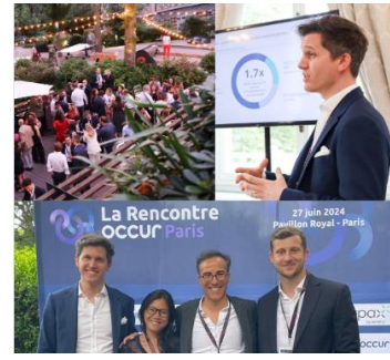
La rencontre OCCUR Au Pavillon Royal, Le 27 juin 2024