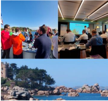
Club Expert, Generali Grand Ouest Du 19 au 21 juin 2024