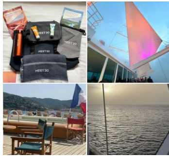
Meet 30, Nortia Croisière Du 17 au 21 juin 2024