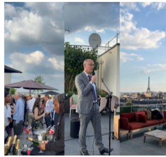
Summer Party Clients Sienna IM, À Paris, Le 26 juin 2024